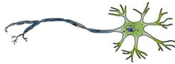
صورة للخلية العصبية

تعريف اخر "توني بوزان" فى نهاية الستينيات إنها طريقة رائعة تعتمد على رسم كل ما تريده فى ورقة واحدة بشكل منظم تحاول فيها قدر الإستطاعة استبدال الكلمات برسمه تدل عليها بحيث تستطيع وضع كل ما تريد فى ورقة واحدة بطريقة مركز ومختصرة وسهلة التذكر بالنسبة لك (1) .